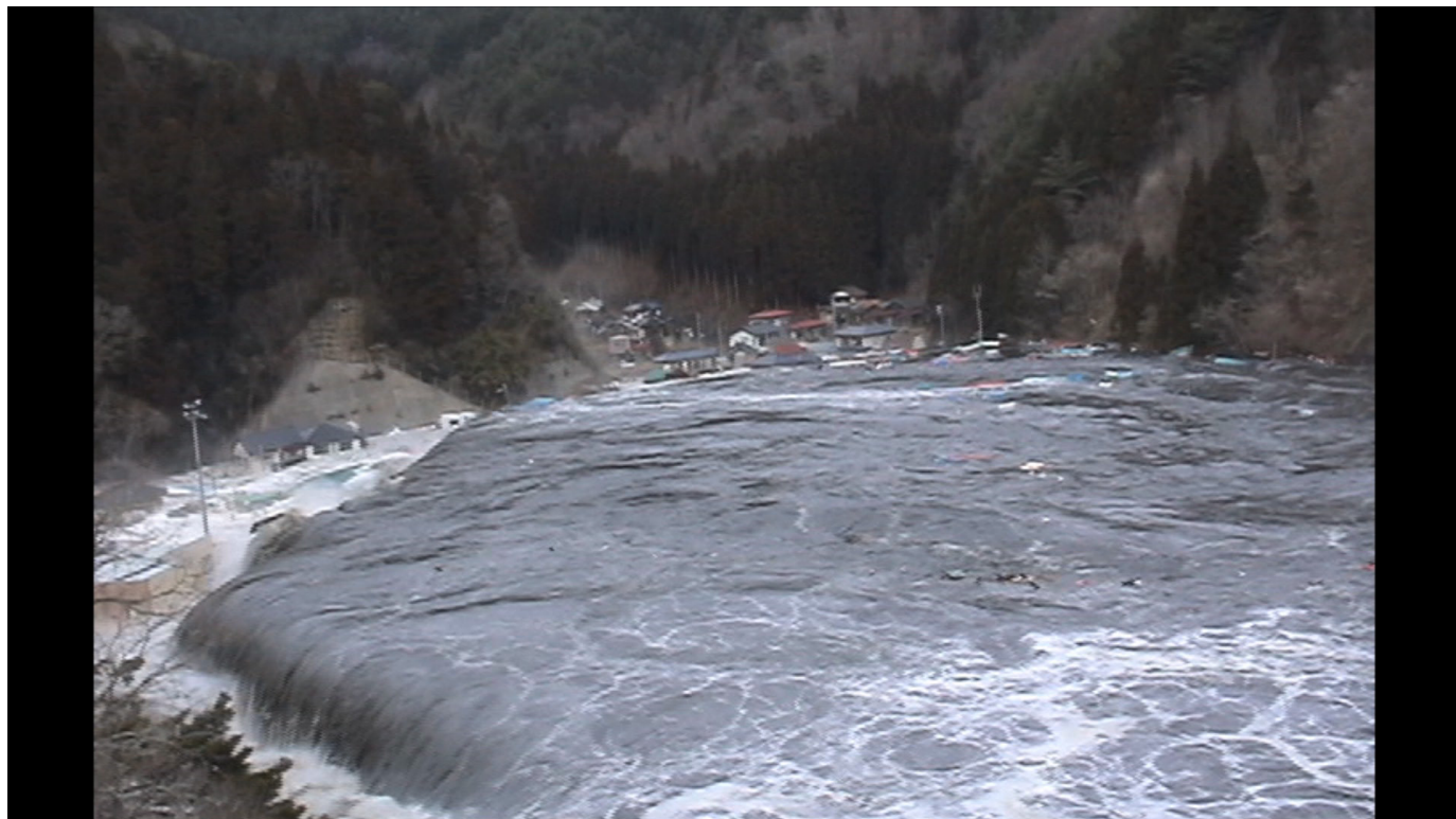
「両石港を襲う津波」瀬戸元 / Tsunami attacking Ryoishi Port, filmed by Hashime Seto 2011 ©